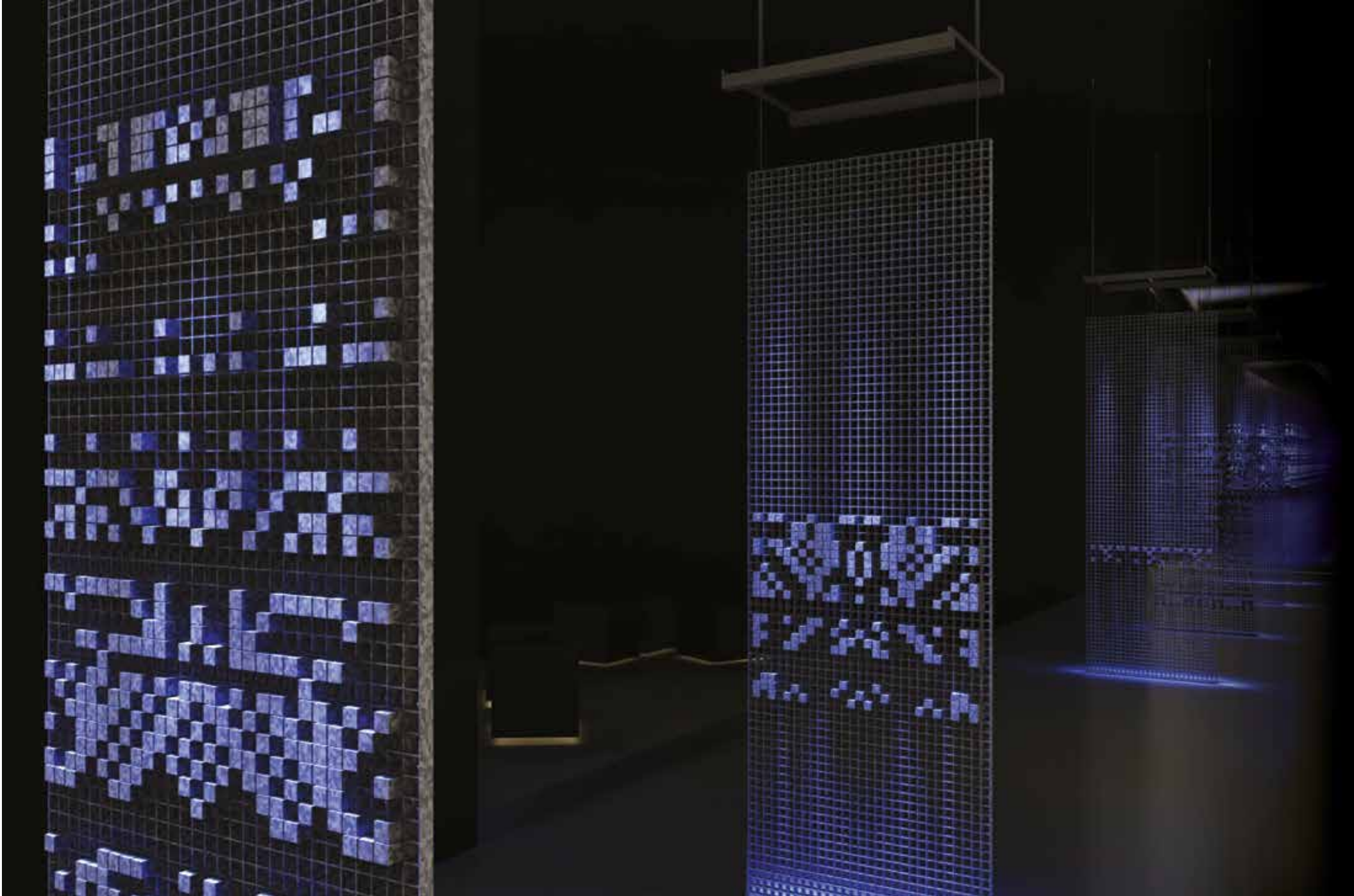
Visual design for the Reziduum exhibition